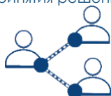
Нет обмена данными с третьими лицами

Нет автоматизированного принятия решений