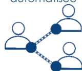
Pas de partage de données avec des tiers

Smart Matching Tool est un système d'aide à la décision . Il n'est pas conçu pour prendre des décisions automatisées . Il y a toujours un humain dans la boucle (coordinateur de projet) qui prend la décision finale.