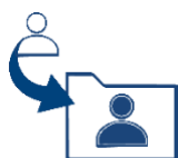
Recopilación directa de datos

Este aviso (la " política de privacidad ") tiene por objeto informarle sobre nuestras prácticas con respecto a la recopilación , el uso y la divulgación de su información personal una vez que participe en el Programa de Orientación Social ORIENT8 .